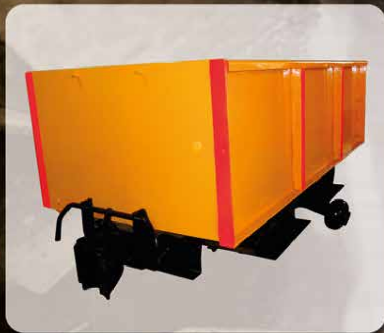
Carro tipo Gramby