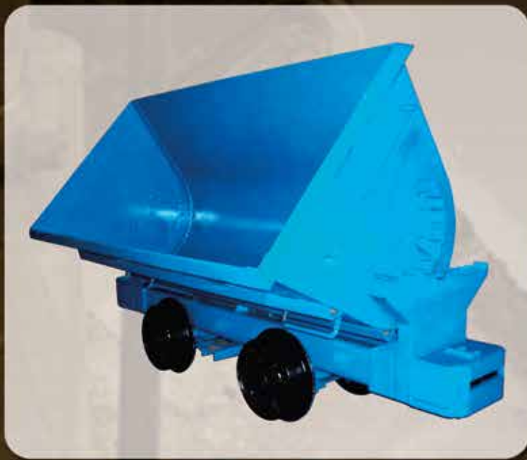
Carro Tipo U35/V40